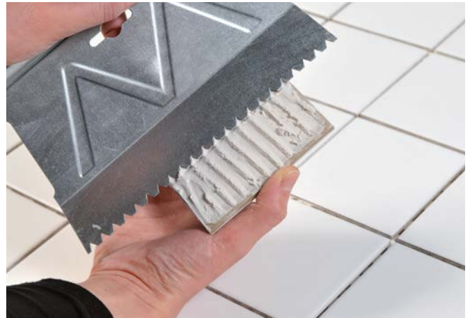
1 : J'APPLIQUE