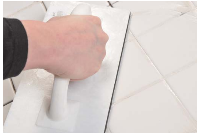
3 : JE JOINTOIE

Ce document technique peut faire l'objet de mise à jour, il est de la responsabilité de l'utilisateur de contrôler systématiquement si une version plus récente est disponible sur notre site www.cermix.com . Il est de la responsabilité de l'applicateur de contrôler la compatibilité et l'adéquation des produits pour la réalisation des travaux. Des essais peuvent être réalisés au préalable pour valider le bon comportement des produits.