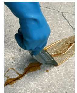
3 : Spatuler à zéro