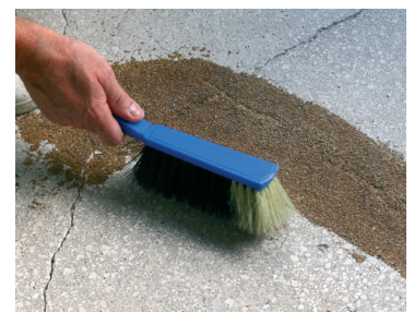
5 : Nettoyer le sable

Ce document technique peut faire l'objet de mise à jour, il est de la responsabilité de l'utilisateur de contrôler systématiquement si une version plus récente est disponible sur notre site www.cermix.com . Il est de la responsabilité de l'applicateur de contrôler la compatibilité et l'adéquation des produits pour la réalisation des travaux. Des essais peuvent être réalisés au préalable pour valider le bon comportement des produits.