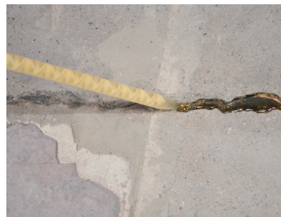
2 : Combler la fissure