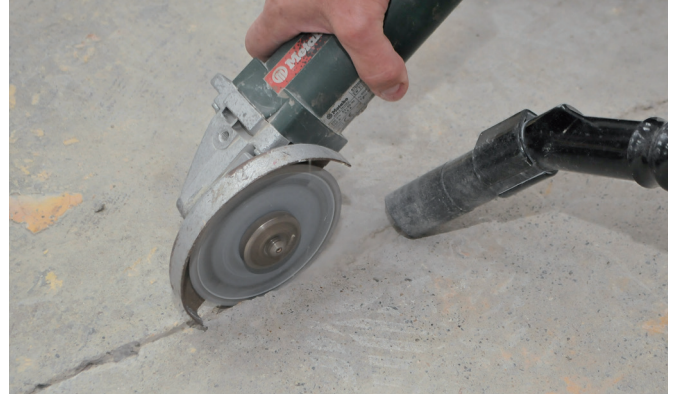
1 : Ouvrir la fissure