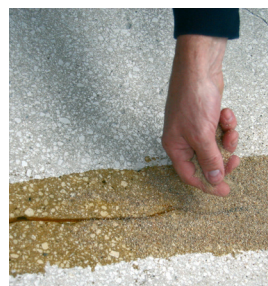
4 : Sabler à refus