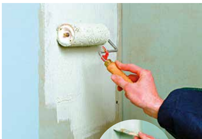
1 ste laag CERMICRYL