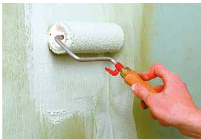
2 de laag CERMICRYL