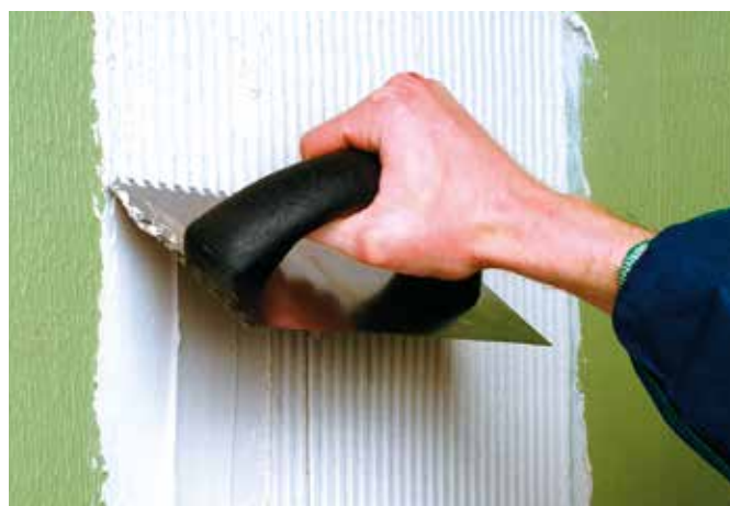
Plaatsen van CERMIPLUS of CERMIFIX

(1) Informatie betreffende het uitstoten van vluchtige bestanddelen in de lucht binnen, met een kans op toxiciteit door inademing, op een schaal van A+ (heel lage uitstoten) tot C (hoge uitstoten).